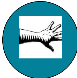
POB XUA/POB QHOV TXHAB